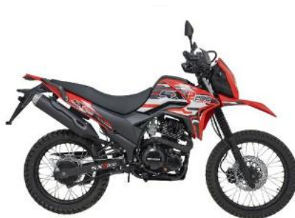
Genesis SX2 200 c.c.

https://genesisnic.com/tienda/sx3-250-4v/