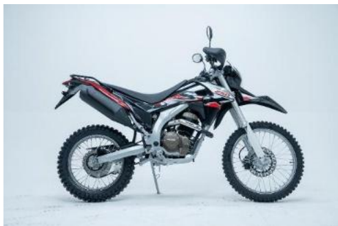
Genesis SX3 250 c.c.

Les motos proposades per a aquesta ruta són els models GENESIS SX3 250 c.c. i/o GENESIS SX2 200 c.c., ambdues de fabricació xinesa i de 4 temps. Són aptes per circular tant per carretera com per camins de terra.