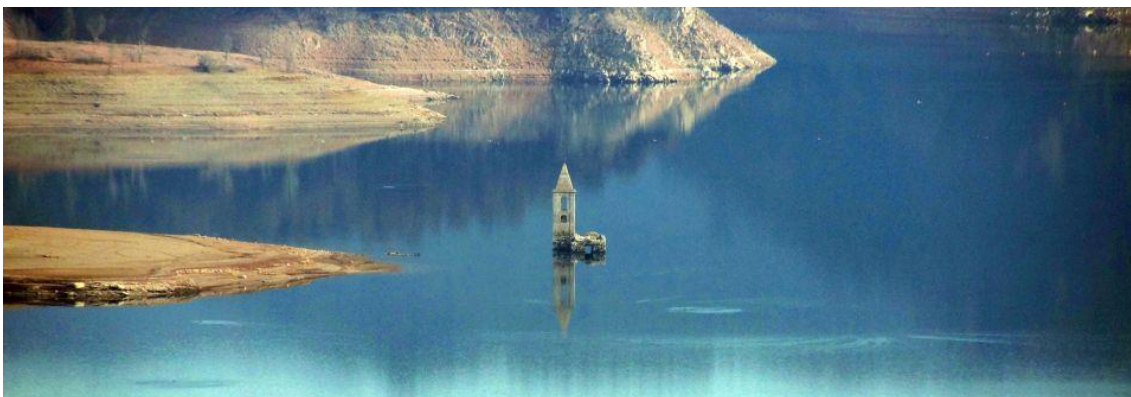
Campanario del pantano de Sau

1er día: Encuentro en el hotel Torre Martí de Sant Julià de Vilatorca por la tarde para situarse en el hotel, preparar las motos, cena y alojamiento