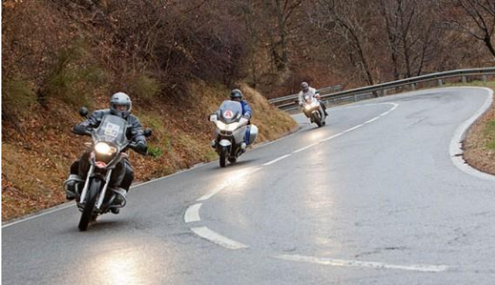
PUERTO COLLADA DE TOSES