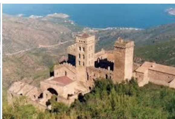
Sant Pere de Rodes.