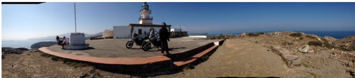
Cap de Creus.

4to día: Después del desayuno preciosa etapa de aproximadamente 220 kms todo asfalto que nos llevará hasta Cadaqués, y el Cap de Creus para continuar dirección al Pirineo pasando por el Monasterio Románico de Sant Pere de Rodes, y seguiremos por la Serra de l’Albera hasta el linde Francia – España, donde durante la guerra civil cruzaron tantos emigrantes hacia Francia. Volveremos a entrar a España por el puerto de Coll d’Ares hasta Ripoll donde cenaremos y pernoctaremos.