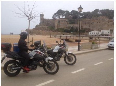
Tossa de Mar