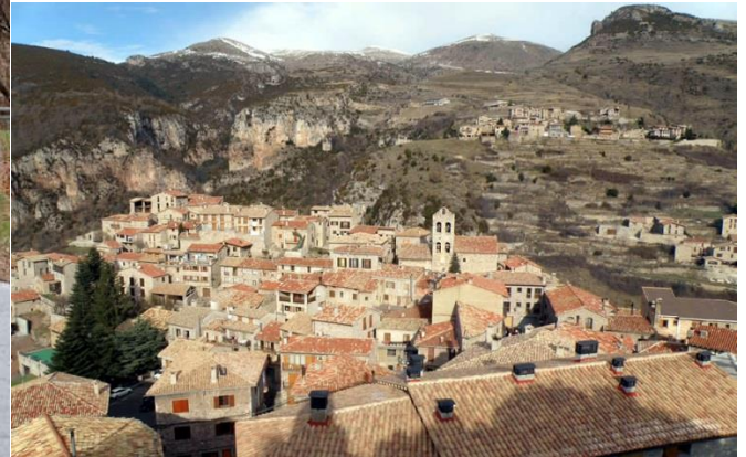
CASTELLAR DE N'HUG