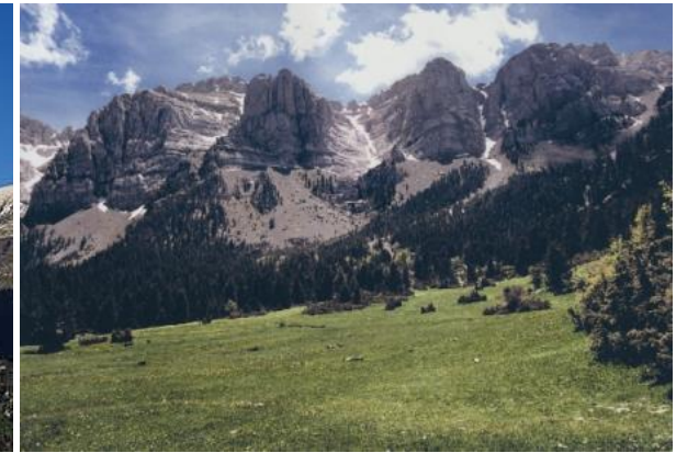
Cadí Moixeró – Parc Nacional del Pedraforca.

6º día: Se acaba nuestra aventura pero aún nos queda el día de hoy para después de dejar el precioso pueblo de Sant Llorençs de Morunys dirigirnos dirección sud siguiendo a tramos el curso del Río Llobregat. Pasarán por Cardona y sus famosas minas de Sal, y posteriormente a Manresa donde ya se divisan claramente las Montañas de Montserrat. Visita obligatoria. Después de visitar Montserrat más curvas hasta llegar al sitio donde empezamos. Fin de nuestra aventura.