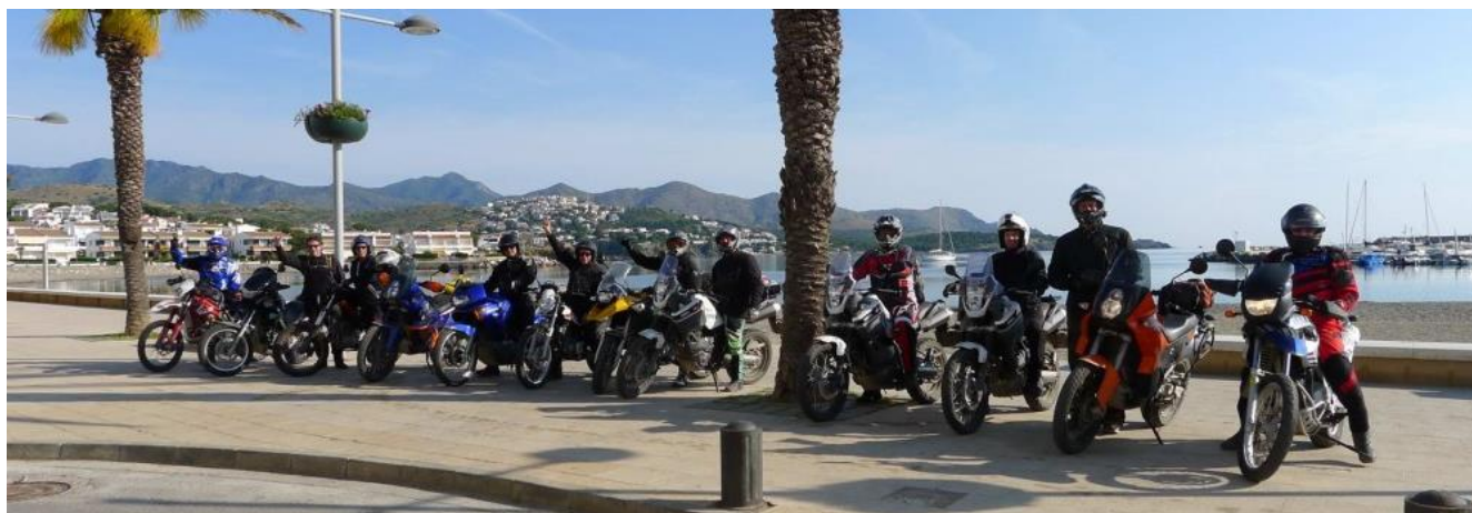
Salida en Llançà

Por la tarde encuentro en el hotel de Llançà con los depósitos de las motos llenos para la salida del día siguiente. Presentación del guía y de los moteros, cena y alojamiento.